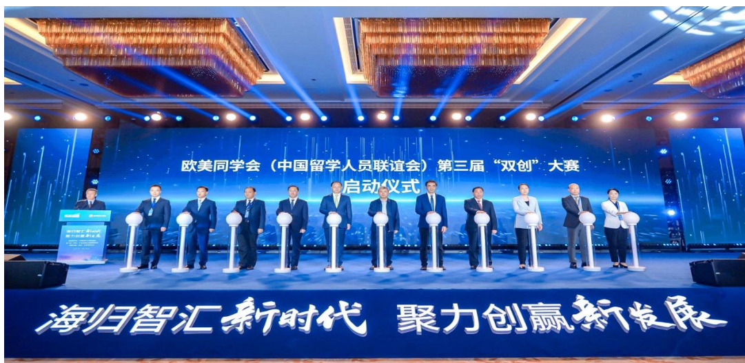
欧美同学会第三届“双创”大赛启动仪式现场

和前沿科技，不仅帮助参赛企业和团队完善项目，还实实在在地找到与资本、市场的对接渠道。